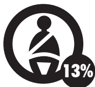
No llevar puesto el cinturón