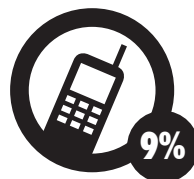
Uso del teléfono móvil