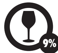
Consumo de Alcohol